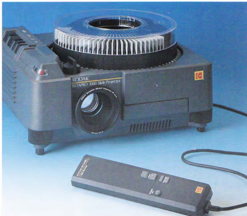
Proiettore KODAK EKTAPRO 3000 con comando a distanza a cavo KODAK EKTAPRO (accessorio)