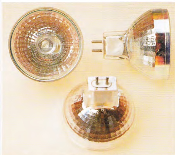
Lampade di proiezione KODAK EKTAPRO EXR 82V/300W/35h FHS 82V/300W/70h