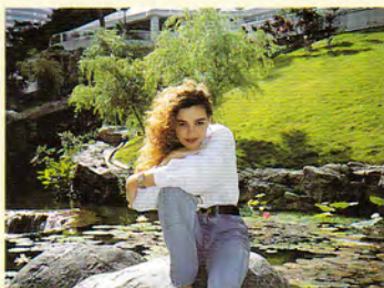
FLASH ATTIVATO INTENZIONALMENTE