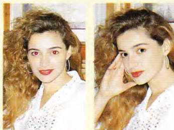
SENZA DISPOSITIVO „ANTI OCCHI ROSSI“