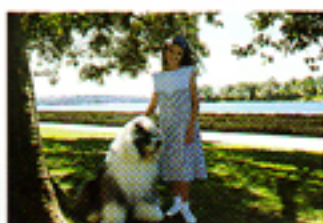
Con il sistema di misurazione tradizionale