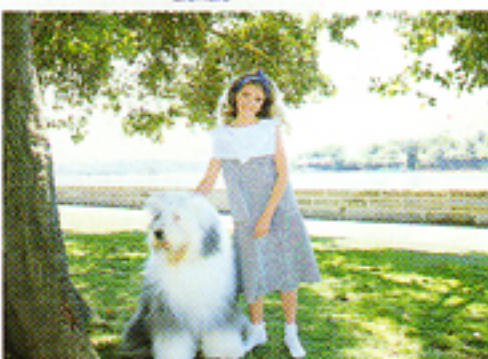
Con il sistema di misurazione con prevalenza al centro della AF-E II.