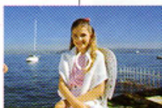
Con il soggetto nella zona di autofocus, premete leggermente il pulsante di scatto.

Con la Minolta AF-E II è sempre possibile cambiare a piacere la composizione delle immagini. Dopo aver premuto parzialmente il pulsante di scatto potrete infatti ricomporre nel mirino l'inquadratura desiderata. Potete anche annullare questa funzione se cambiate improvvisamente idea.