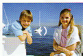
Ricomponete l'inquadratura desiderata, senza staccare il dito dal pulsante, poi premete a fondo per fotografare.