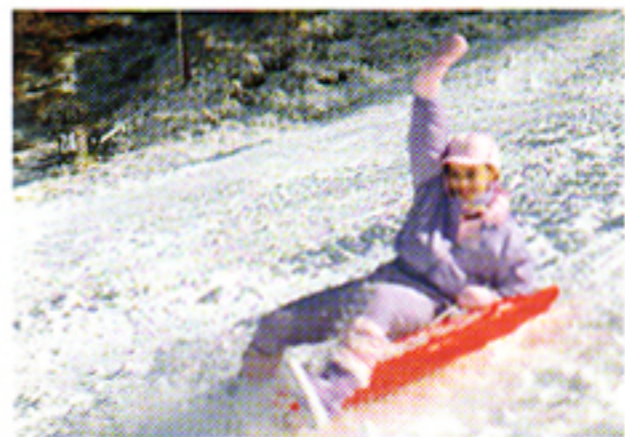
Con autofocus tradizionale