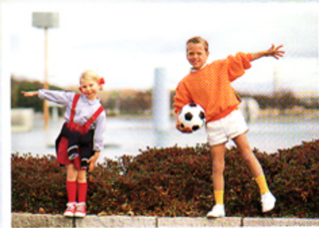
Con autofocus a "multi-raggio" Minolta