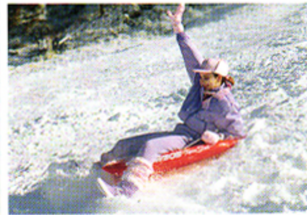
Con autofocus a "multi-raggio" Minolta