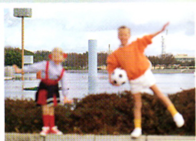
Con autofocus tradizionale