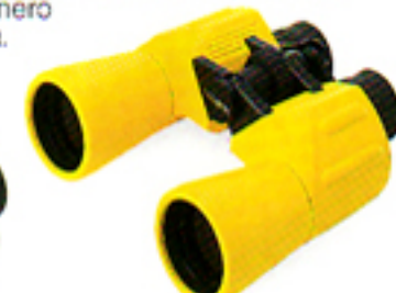
7 × 50 Giallo