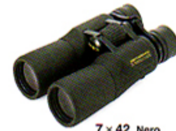
7 × 42 Nero (Wide Angle)