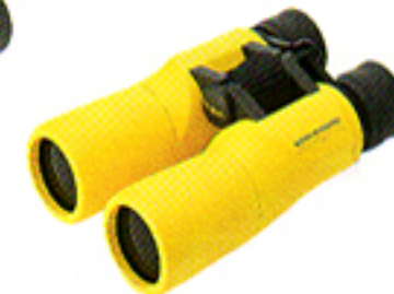
10 × 42 Giallo (Wide Angle)