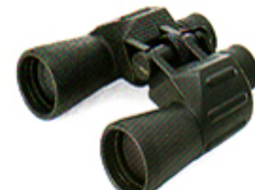
7 × 50 Nero