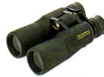
10 × 42 Nero (Wide Angle)