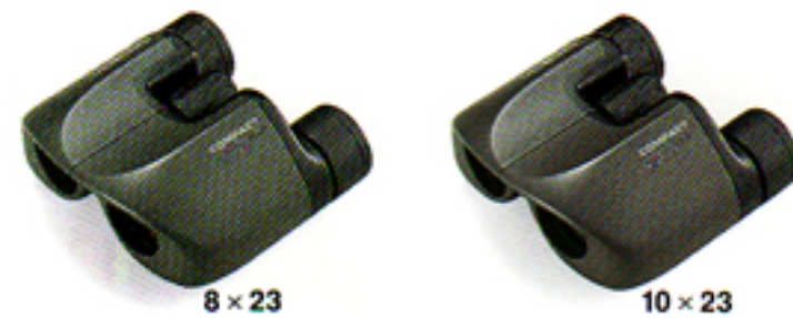
8 × 23

I binocoli compact Minolta offrono un'immagine nitida e chiara, sono leggeri e comodi da trasportare. La messa a fuoco è rapida e facile, ed i prismi BAK-4 ad alte prestazioni consentono la correzione delle aberrazioni cromatiche. Il trattamento multistrato delle lenti anteriori garantisce una chiarezza eccezionale. I binocoli compact garantiscono nell'insieme elevate prestazioni in una forma contenuta e con un costo relativamente basso.