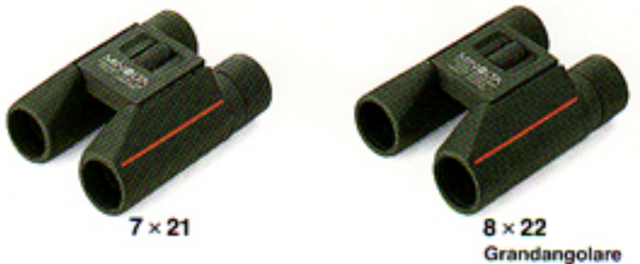
7 × 21

Scegliete tra i quattro modelli Minolta Pocket leggeri ed eleganti. Questi apparecchi dalle prestazioni ottiche di alta precisione offrono un campo visivo vasto e molto chiaro. Due dei quattro modelli - il grandangolare 8x22 ed il grandangolare 10x25 - vi offrono un campo visivo più vasto che mai. Tutti i modelli Pocket Minolta presentano un rivestimento in gomma morbida e lenti con trattamento multistrato per un'immagine più luminosa. Inoltre, il preciso sistema con prisma a tetto, di cui sono tutti dotati, garantisce l'eccezionale qualità Minolta anche in un formato veramente tascabile.