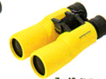
7 × 42 Giallo (Wide Angle)