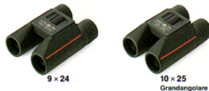
9 × 24