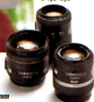
AF 85 mm f/1,4 G