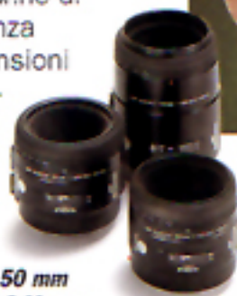
AF 50 mm f/2,8 Macro