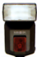
Flash a Programma 3400HS(D)