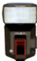
Flash a Programma 5400HS(D)

Il flash incorporato della Dynax 303si ha un'ampia portata per consentirvi di catturare di notte o in situazione di scarsità di luce anche soggetti ad una notevole distanza. Inoltre, potrete sperimentare tutte le straordinarie possibilità fotografiche offerte dal controllo flash a distanza ad alta tecnologia, che aumenta la versatilità e il controllo della luce flash per ottenere con facilità fotografie di livello professionale.