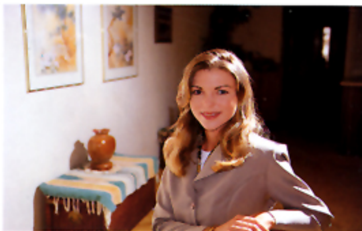
Con comando flash a distanza TTL.