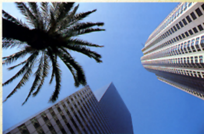
Con obiettivo grandangolo