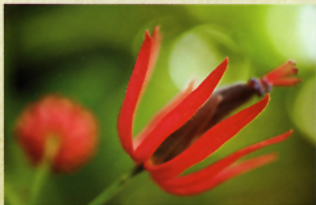
Con obiettivo Macro