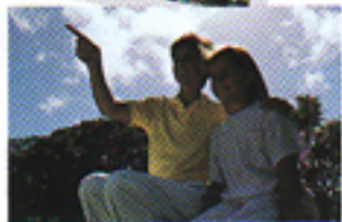
Con il sistema di misurazione tradizionale

Voi non dovrete pensare ad alcuna impostazione. Inquadrate semplicemente il vostro soggetto al centro del mirino ed otterrete fotografie sempre perfettamente nitide e chiare.