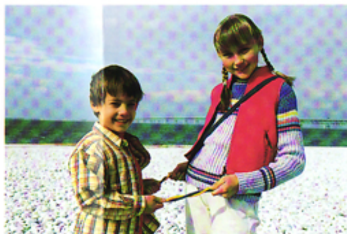
Con AF multi-raggio

Operazioni in completo automatismo per ottenere con facilità splendidi risultati