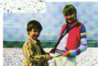
Senza AF multi-raggio

Queste due speciali caratteristiche offerte dalla RIVA ZOOM 115 garantiscono risultati d'effetto anche ai meno esperti. Il sistema AF multi-raggio è dotato di area di messa a fuoco grandangolare e garantisce una precisa messa a fuoco anche se i soggetti sono affiancati. L'esposizione automatica consente di impostare la corretta esposizione anche nelle condizioni di luce più difficili.