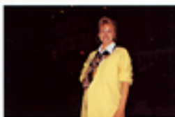
Senza impostazione ritratti notturni