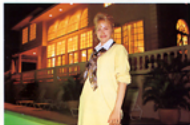
Con impostazione ritratti notturni

Scegliete questa impostazione per mantenere intatta sullo sfondo delle vostre riprese, l'atmosfera delle luci notturne.