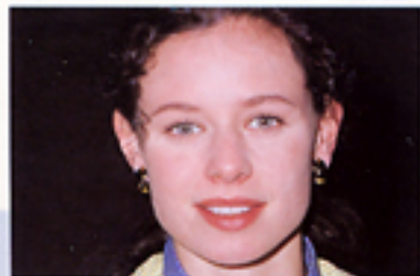
Con funzione anti-occhi rossi

Questa caratteristica consente di ridurre lo sgradevole effetto degli occhi rossi nelle fotografie con flash e di mantenere naturale lo sguardo del vostro soggetto.