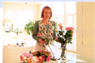
Con compensazione dell'esposizione