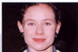
Senza funzione anti-occhi rossi