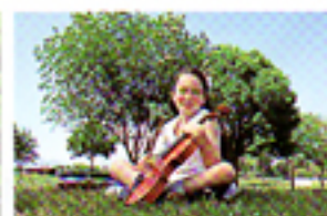
Non più immagini sfocate