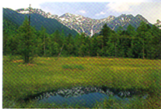
Con impostazione "Paesaggi"

Grazie all'impostazione "Paesaggi" della Riva Zoom 70EX potrete ottenere vivaci e nitide immagini di soggetti lontani, riprese anche attraverso il vetro di un finestrino.