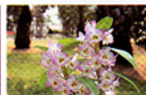
La maggior parte delle fotocamere non consente una distanza così ravvicinata