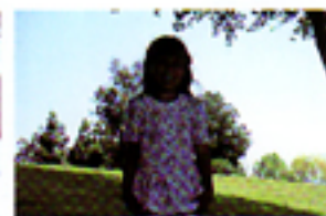
La maggior parte delle fotocamere lascia i volti in ombra