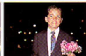
La maggior parte delle fotocamere lascia scuro lo sfondo