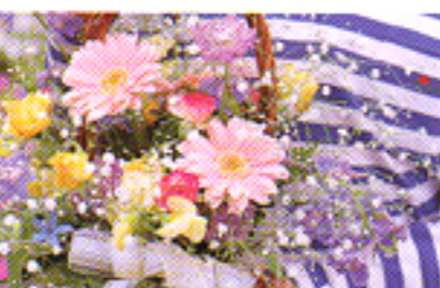
Distanza ravvicinata (Close-up)