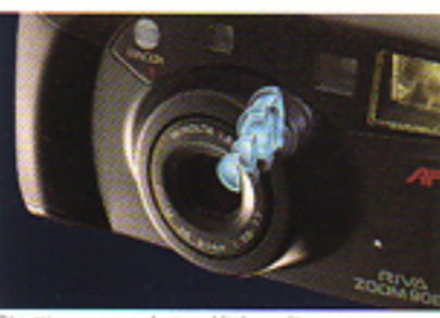
Obiettivo zoom asferico «High-quality» con trattamento multiplo

Facilità di impiego e splendidi risultati Inquadrate e premete semplicemente il pulsante di scatto. La Riva Zoom 90EX eseguirà automaticamente la messa a fuoco e controllerà il livello di luminosità della vostra immagine. L'autofocus intelligente a «Raggi Multipli» (tre raggi LED) consentirà di ottenere la messa a fuoco precisa anche di soggetti in posizione decentrata. Il sistema di esposizione automatica con misurazione a doppio segmento regolerà e controllerà la luminosità della vostra immagine, permettendovi di fotografare anche in controcultura con un buon bilanciamento luci/ombre. E tutte queste funzioni «intelligenti» vi consentiranno di concentrarvi maggiormente sul vostro soggetto.