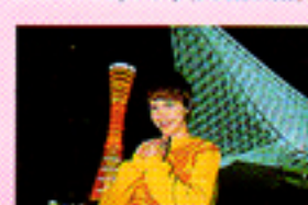
Con impostazione «Ritratti Notturni»