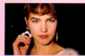
Con funzione pre-lampi (anti occhi rossi)

Il flash scatta automaticamente in presenza di scarsa luminosità e la funzione pre-lampi riduce lo sgradevole inconveniente degli occhi rossi, così frequente nei ritratti ripresi con il flash. Quando il vostro soggetto è in controluce selezionate l'impostazione «Luce Diurna»: il flash scatterà ed eviterà che i volti dei vostri soggetti risultino scuri in controluce. L'impostazione «Esclusione Flash» vi permetterà di rendere fedelmente l'atmosfera di una fotografia scattata a lume di candela o di fotografare anche dove è proibito usare il flash, come ad esempio nei musei. L'impostazione «Ritratti notturni» vi consentirà di ottenere splendide immagini valorizzando anche lo sfondo che altre fotocamere lascerebbero completamente al buio.