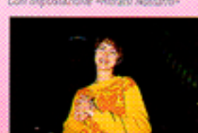
Senza impostazione «Ritratti Notturni»