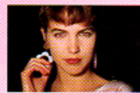
Senza funzione pre-lampi (anti occhi rossi)