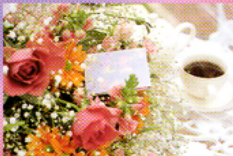
Distanza minima 60cm

Le vostre immagini saranno sempre perfette grazie all'obiettivo asferico di alta qualità con trattamento multistrato di questa nuova Minolta. Il suo Autofocus di precisione a 250 punti vi garantirà un'assoluta fedeltà di messa a fuoco, mentre il suo sistema di esposizione automatica vi assicurerà una perfetta nitidezza dell'immagine. E potrete ottenere belle fotografie da una distanza minima di 60cm fino a qualunque altra lunghezza focale.