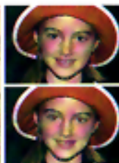
Con funzione anti-occhi rossi