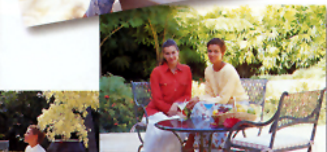
Stampa tipo C (classica)