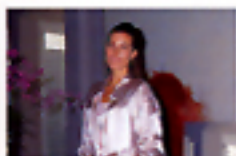
Con flash ad intensità morbida

Il flash incorporato della VECTIS 25 offre quattro diverse impostazioni per rispondere ad ogni vostra necessità di ripresa. Con l'impostazione automatica il flash scatta sempre quando necessario; l'attivazione forzata, l'esclusione del flash e l'impostazione automatica, con o senza funzione anti-occhi rossi, vi consentono di adattare l'uso del flash alle più varie situazioni. Per le fotografie a distanza ravvicinata il flash è inoltre dotato di un'intensità morbida del lampo per evitare sovraesposizioni o immagini sbiadite.