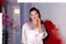
Senza flash ad intensità morbida