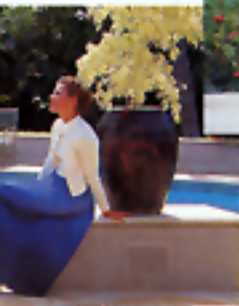
Stampa tipo P (panorama)