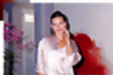
Senza flash ad intensità morbida