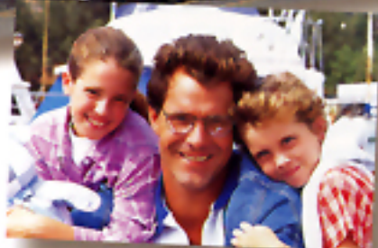
FORMATO DI STAMPA "C" (classico)