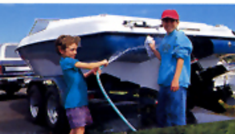
FORMATO DI STAMPA "H" (grande)