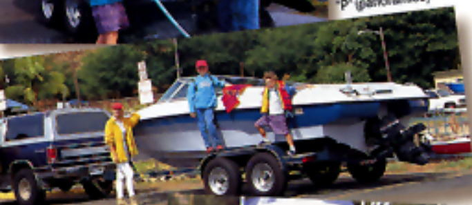
FORMATO DI STAMPA "P" (panoramico)