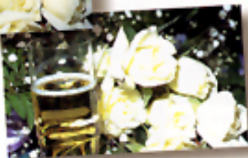
Con "Soft Flash"