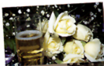
Senza "Soft Flash"

Il flash incorporato della VECTIS 30 è dotato di 4 diverse impostazioni per le situazioni più varie. Con l'impostazione automatica, il flash scatta sempre quando necessario. Le altre impostazioni comprendono: il flash automatico con funzione anti-occhi rossi, l'attivazione forzata del flash e l'esclusione flash, per fotografare senza problemi in qualunque circostanza. Infine, il flash automatico ad "intensità ridotta" (Soft-Flash) consente di ridurre l'intensità del lampo per evitare il rischio di sovraesposizione nelle fotografie scattate da vicino.