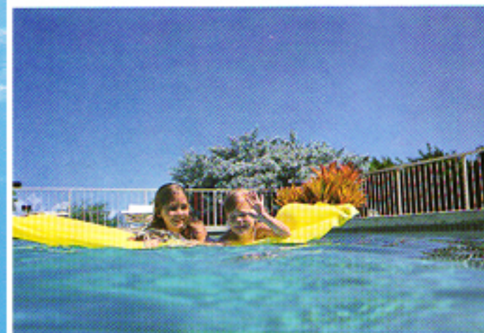
Obiettivo 35mm per panorami e fotografie di gruppo

Posizionate su «ON» l'interruttore principale e l'apparecchio selezionerà automaticamente l'obiettivo grandangolare 35mm (gruppi/paesaggi). Per riprese in primo piano (ritratti) premete semplicemente il pulsante apposito e automaticamente l'obiettivo sarà selezionato sul 50mm. Premetelo di nuovo per tornare sul 35mm. Il campo visivo nel mirino si modificherà di conseguenza.