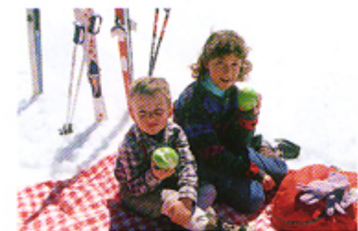
Con il sistema di misurazione con prevalenza al centro della Weathermatic 35 DL.

Il controllo automatico dell'esposizione della Weathermatic 35 DL è programmato elettronicamente per garantire corrette esposizioni nelle condizioni più varie, persino in controluce e con illuminazione spot. Il controllo dell'esposizione è completamente automatico. Il sistema di misurazione con prevalenza al centro della Weathermatic 35 DL dà maggior enfasi al centro del mirino dove normalmente viene inquadrato il soggetto principale. L'esposizione del soggetto risulta sempre corretta indipendentemente dall'illuminazione dello sfondo.