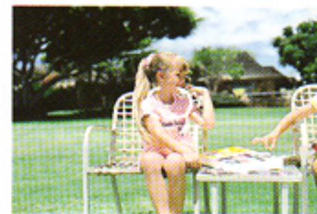
Con il soggetto nella zona di autofocus, premete leggermente il pulsante di scatto.

Quando non volete che il vostro soggetto si trovi al centro del fotogramma, inquadratelo nella zona di autofocus premendo parzialmente il pulsante di scatto, ricomponete poi l'inquadratura desiderata e scattate. Nelle fotografie sott'acqua tenendo premuto il pulsante «Close-up» potrete riprendere scene marine a distanza ravvicinata.