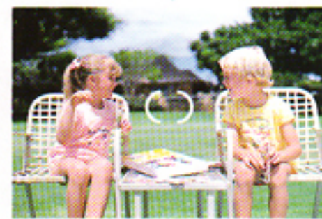
Ricomponete l'inquadratura desiderata e premete a fondo il pulsante di scatto per fotografare.