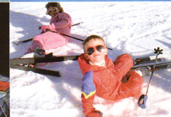
Obiettivo 50mm per ritratti e fotografie a distanza ravvicinata