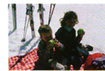
Con un sistema di misurazione tradizionale.