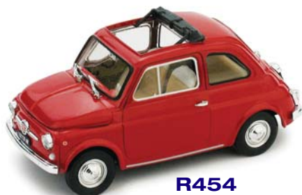
R454 Fiat 500F (1965-72) aperta ( 12 colorazioni )