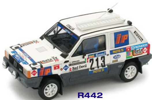
R442 Fiat Panda 4x4 Parigi-Dakar (1984) Giraudo Contegiaco #213