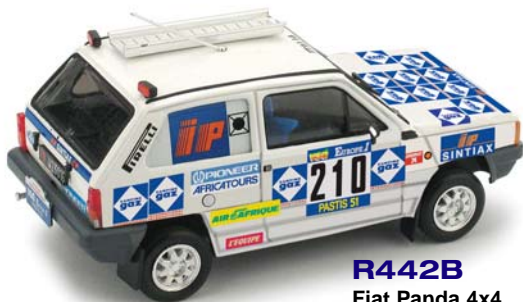
R442B Fiat Panda 4x4 Parigi-Dakar (1984) Baghetti-Badois #210