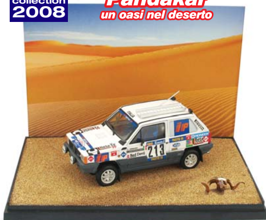
AS49 Fiat Panda 4x4 Parigi-Dakar (1984) Giraudo Contegiaco #213 (Pilota e navigatore incusi)