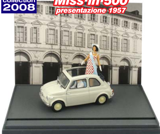
AS48 Fiat nuova 500 Presentazione con parata di Miss per le vie di Torino, piazza San Carlo. (1957)