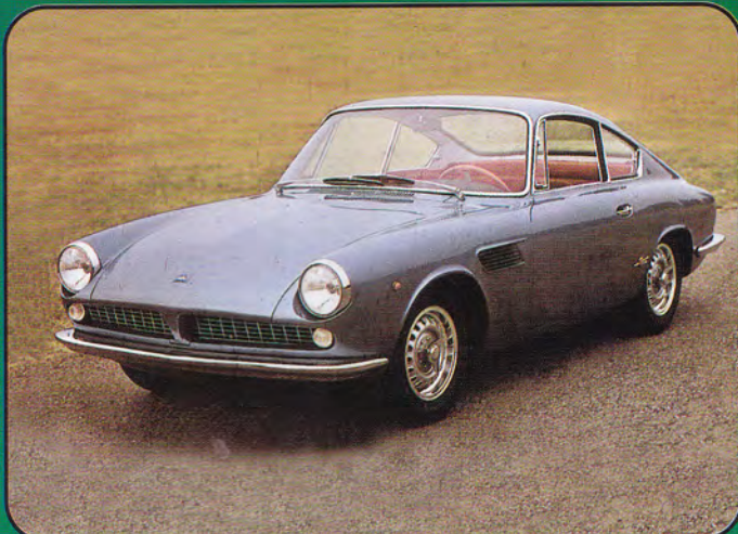
PI50 - ASA 1000 Coupe Stradale Colore Rosso - 1964 PI51 - ASA 1000 Coupe Stradale Colore Blu Met. - 1964 PI52 - ASA 1000 Coupe Corsa - 1964