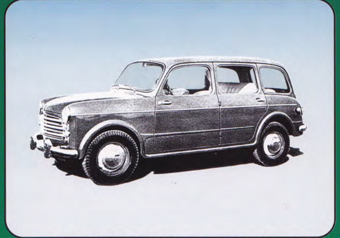
PK280 - FIAT 1100/103 Familiare Stradale - 1953