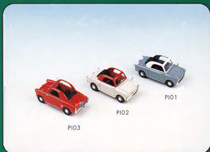
PI01 - Autobianchi Bianchina Trasformabile Open Colore Celeste/Bianco PI02 - Autobianchi Bianchina Trasformabile Open Colore Avorio/Rosso PI03 - Autobianchi Bianchina Trasformabile Open Colore Rosso