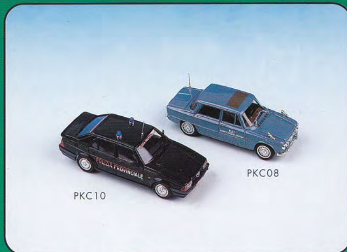
PKC08 - Alfa Romeo Giulia Berlina "RAI" - 1964 PKC10 - Alfa Romeo 75 T.S. "Polizia Provinciale Genova" - 1989