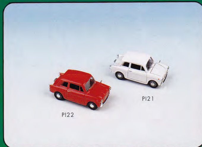
PI20 - Autobianchi Bianchina Berlina Stradale Colore Verde PI21 - Autobianchi Bianchina Berlina Stradale Colore Celeste PI22 - Autobianchi Bianchina Berlina Stradale Colore Rosso