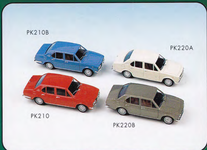
PK210 - Alfa Romeo Alfetta 1800 Stradale - 1972 PK220 - Alfa Romeo Alfetta 1600 Stradale - 1974