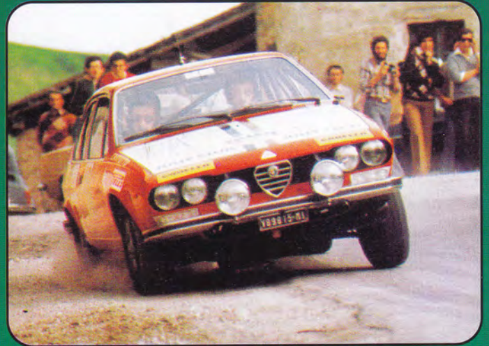
PK260 - Alfa Romeo Alfetta GTV 1600 Rally - 1975