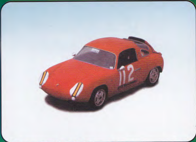
PI30 - FIAT Abarth 1000 Bialbero "Clienti" - 1964 PI31 - FIAT Abarth 1000 Bialbero Monza - 1964 PI32 - FIAT Abarth 1000 Bialbero Sebring - 1964