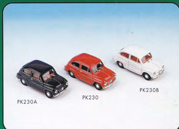
PK230 - FIAT 750 D Stradale - 1967