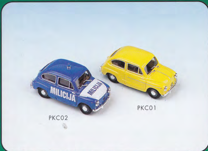
PKC01 - Zastava 750 Stradale - 1960 PKC02 - Zastava 750 "Milicija" - 1960