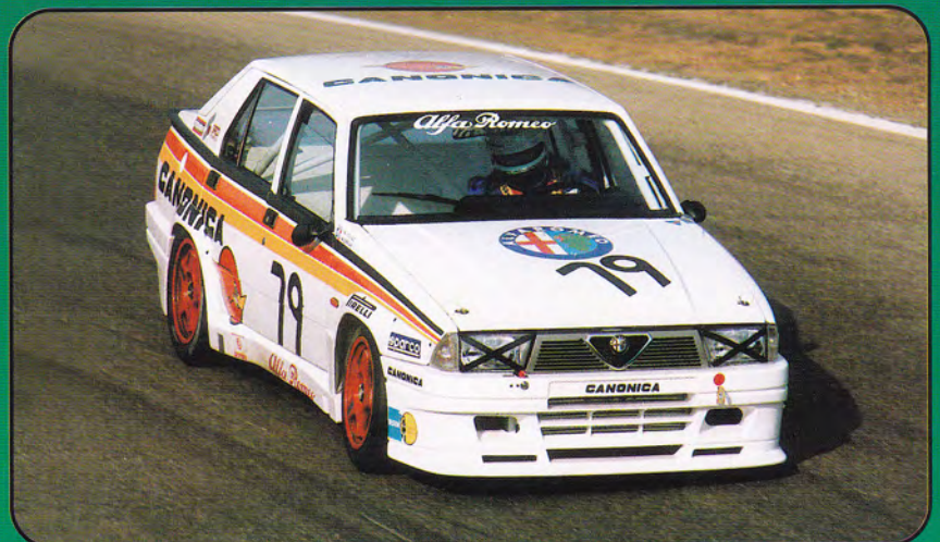
PK2012 - Alfa Romeo 75 Evoluzione "Canonica" - 1988