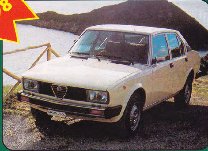
PK240 - Alfa Romeo Alfetta 2000 Stradale - 1977