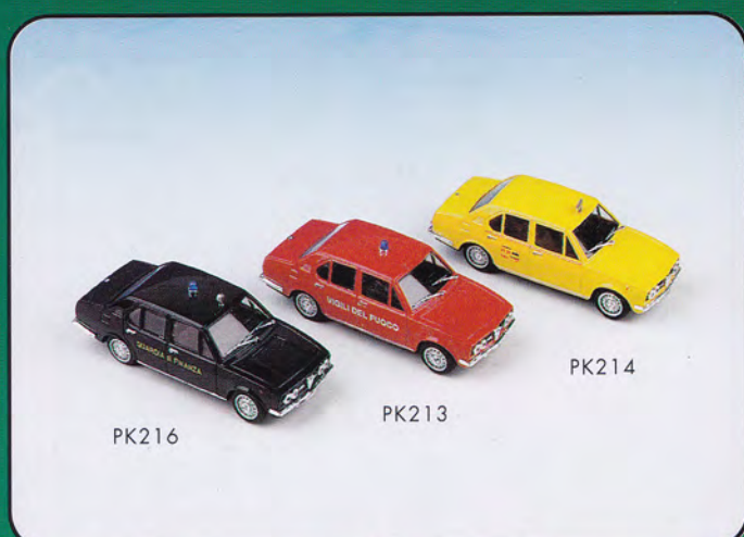
PK213 - Alfa Romeo Alfetta 1800 "Vigili del Fuoco" - 1972 PK214 - Alfa Romeo Alfetta 1800 "Taxi Roma" - 1972 PK216 - Alfa Romeo Alfetta 1800 "Guardia di Finanza" - 1972