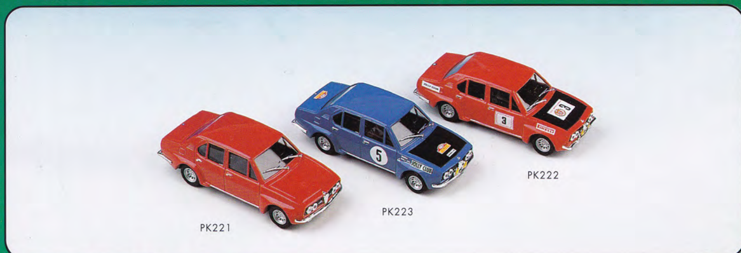
PK221 - Alfa Romeo Alfetta Gr.2 "Presentazione" - 1974 PK222 - Alfa Romeo Alfetta Gr.2 "Rally S. Martino" - 1974 PK223 - Alfa Romeo Alfetta Gr.2 "Rally 333 Minuti" - 1974