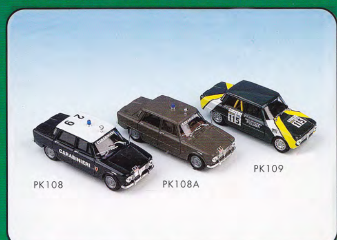
PK108 PK108A PK109

PK104 - Alfa Romeo Giulia Ti Super "Presentazione" - 1964 PK105 - Alfa Romeo Giulia Ti Super "Tour de France" - 1964 PK106 - Alfa Romeo Giulia Ti Super "4 ore di Monza" - 1964 PK107 - Alfa Romeo Giulia Berlina "East African Safari" - 1967