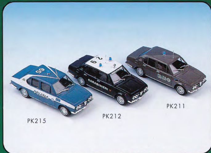
PK211 - Alfa Romeo Alfetta 1800 "Polizia" - 1972 PK212 - Alfa Romeo Alfetta 1800 "Carabinieri" - 1972 PK215 - Alfa Romeo Alfetta 1800 "Polizia" - 1975