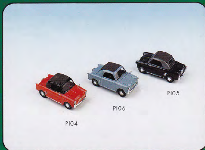
PI04 - Autobianchi Bianchina Trasformabile Closed Colore Rosso/Nero PI05 - Autobianchi Bianchina Trasformabile Closed Colore Blu/Grigio PI06 - Autobianchi Bianchina Trasformabile Closed Colore Celeste