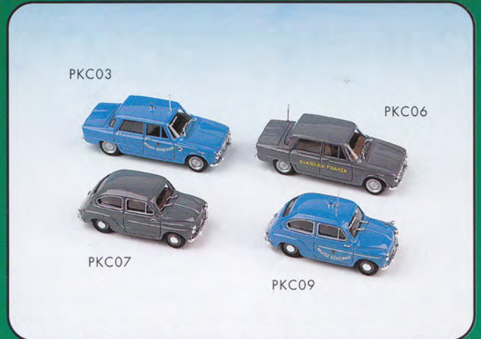
PKC03 - Alfa Romeo Giulia "Vigili Urbani Roma" - 1964 PKC06 - Alfa Romeo Giulia "Guardia di Finanza" - 1964 PKC07 - FIAT 600 D "Guardia di Finanza" - 1960 PKC09 - FIAT 600 D "Vigili Urbani Roma" - 1960