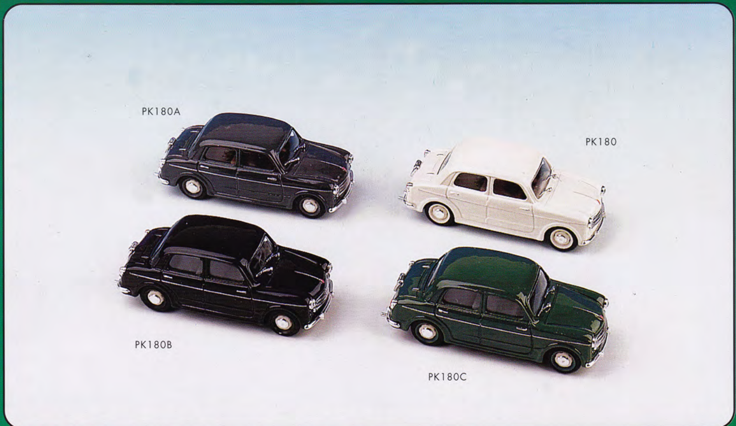
PK180 - FIAT 1100/103 Berlina Stradale vari colori - 1953