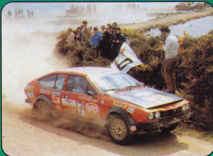
PK261 - Alfa Romeo Alfetta GTV 1800 Rally - 1976