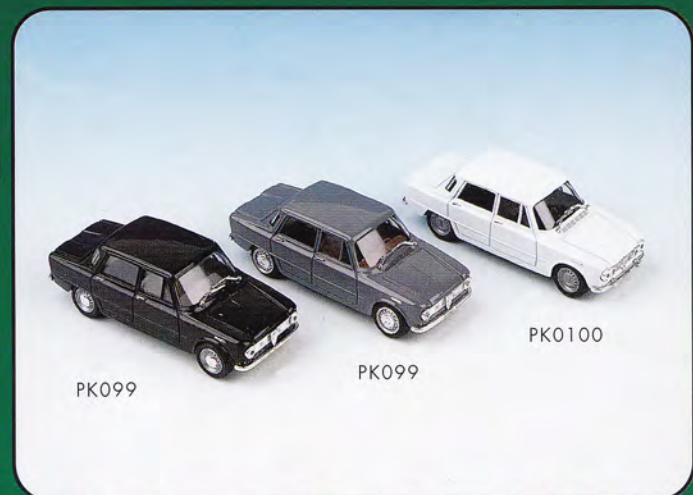
PK099 PK099 PK0100

PK089 - Lancia Fulvia Coupè 3 Montecarlo - 1974 PK089A - Lancia Fulvia Coupè 3 Montecarlo - 1974 PK089B - Lancia Fulvia Coupè 3 Montecarlo - 1974 PK089C - Lancia Fulvia Coupè 3 Montecarlo - 1974