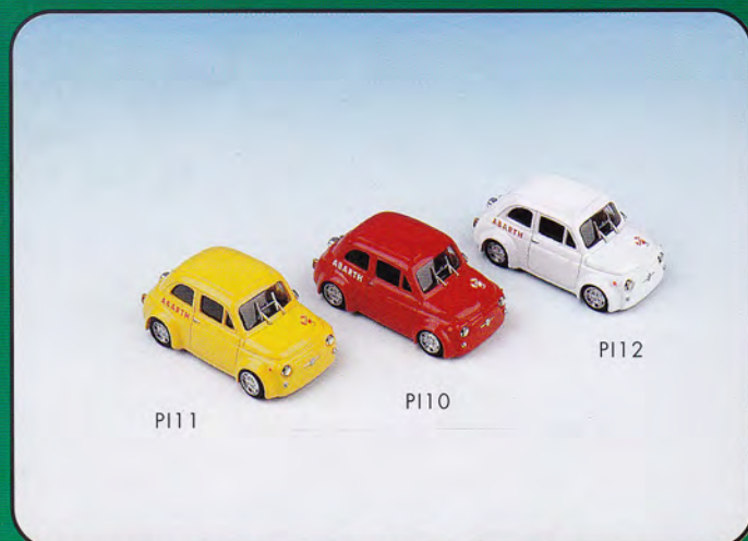
PI10 - FIAT 500 Abarth Gr.2 Colore Rosso PI11 - FIAT 500 Abarth Gr.2 Colore Giallo PI12 - FIAT 500 Abarth Gr.2 Colore Bianco