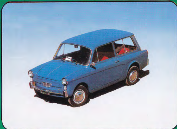
PI70 - Autobianchi Bianchina Panoramica Stradale Vari Colori