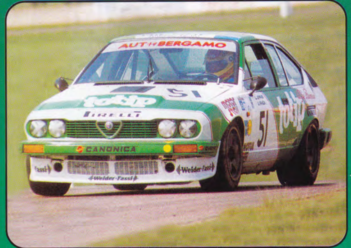
PK262 - Alfa Romeo Alfetta GTV "Totip" Europeo Turismo - 1984