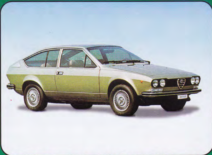
PK250 - Alfa Romeo Alfetta GTV 1600 Stradale - 1974 PK251 - Alfa Romeo Alfetta GTV Turbodelta Stradale - 1976 PK252 - Alfa Romeo Alfetta GTV 6 Stradale - 1978