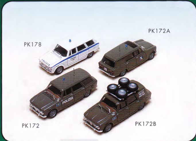
PK178 - Alfa Romeo Giulia Break "Polizia" - 1967 PK172A - Alfa Romeo Giulia Break "Polizia Autostrade" - 1968 PK172B - Alfa Romeo Giulia Break "Assistenza Pantere Storiche" - 1989 PK172 - Alfa Romeo Giulia Break "Polizia Ticinese" - 1967