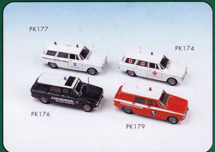
PK174 - Alfa Romeo Giulia Break "Ambulanza" - 1969 PK176 - Alfa Romeo Giulia Break "Carabinieri Cinofili" - 1969 PK177 - Alfa Romeo Giulia Break "Assistenza Humanitas" - 1970 PK179 - Alfa Romeo Giulia Break "Assistenza Vacanze" - 1969