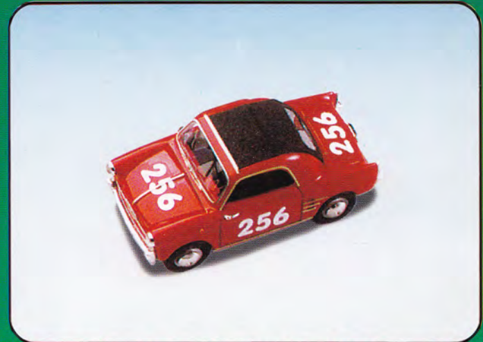
PI07 - Autobianchi Bianchina Trasformabile Corsa - 1966