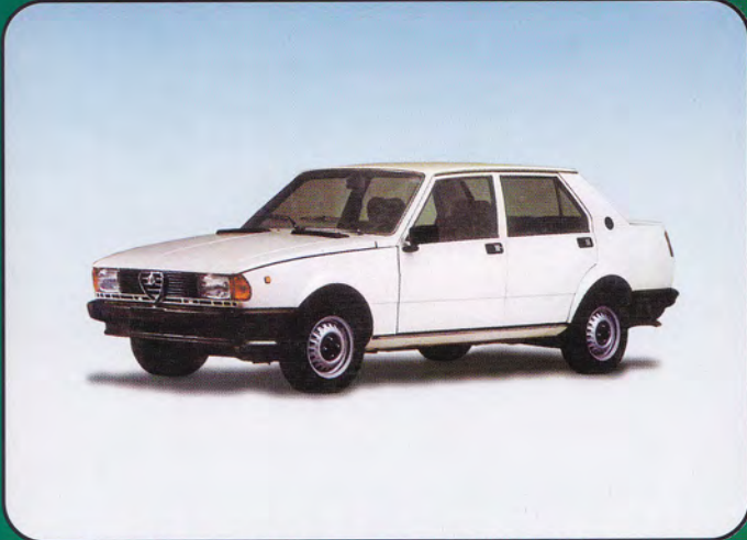
PK270 - Alfa Romeo Giulietta 1600 Stradale - 1977