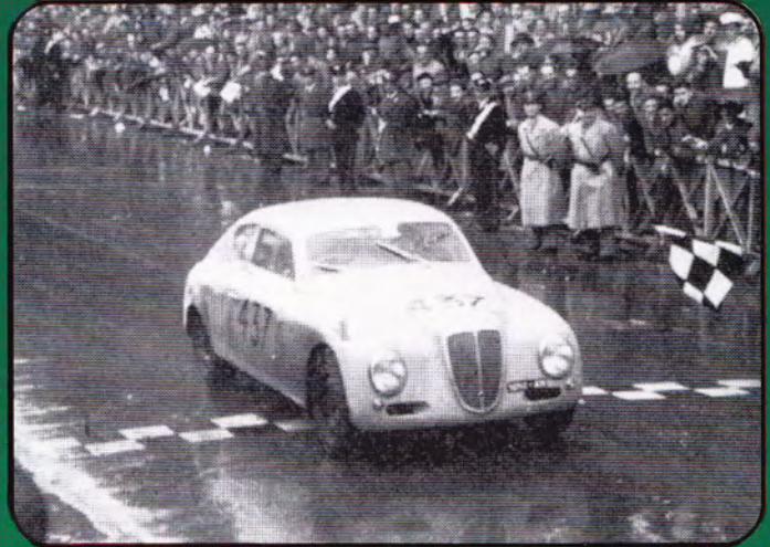
PI40 - Lancia Aurelia B20 Corsa "Clienti" - 1951 PI41 - Lancia Aurelia B20 Corsa Targa Florio - 1952 PI42 - Lancia Aurelia B20 Corsa Mille Miglia - 1952 PI43 - Lancia Aurelia B20 Corsa Le Mans - 1952