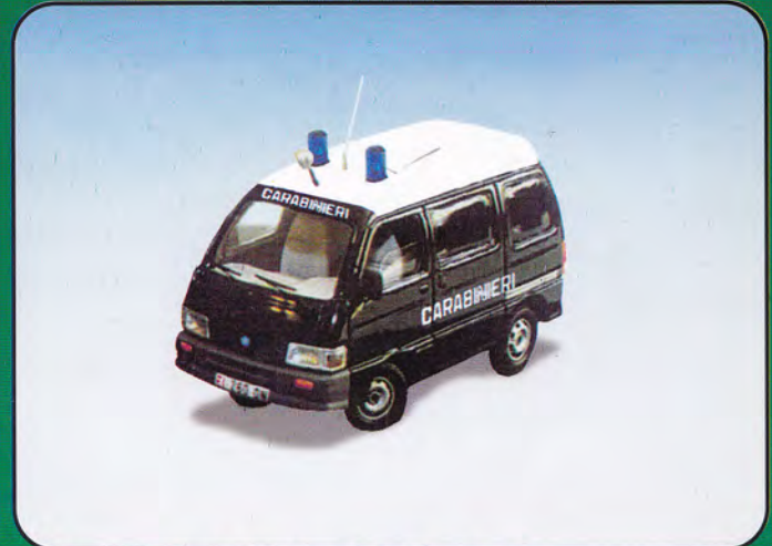
PI60 - Piaggio Porter Stradale Vari Colori PI61 - Piaggio Porter "Carabinieri" PI62 - Piaggio Porter "Vigili del Fuoco"