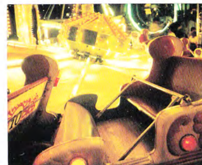
L'esposizione a tempo ha assicurato un'eccellente fotografia in una difficile situazione di luce