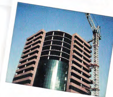
Per documentare l'avanzamento dei lavori.