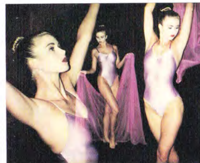
Usando l'esposizione multipla sono state effettuate tre esposizioni sulla stessa fotografia

Permette di fotografare ad intervalli di tempo programmati, adatto specialmente per gli studi di tempo e moto o per la fotografia della natura.