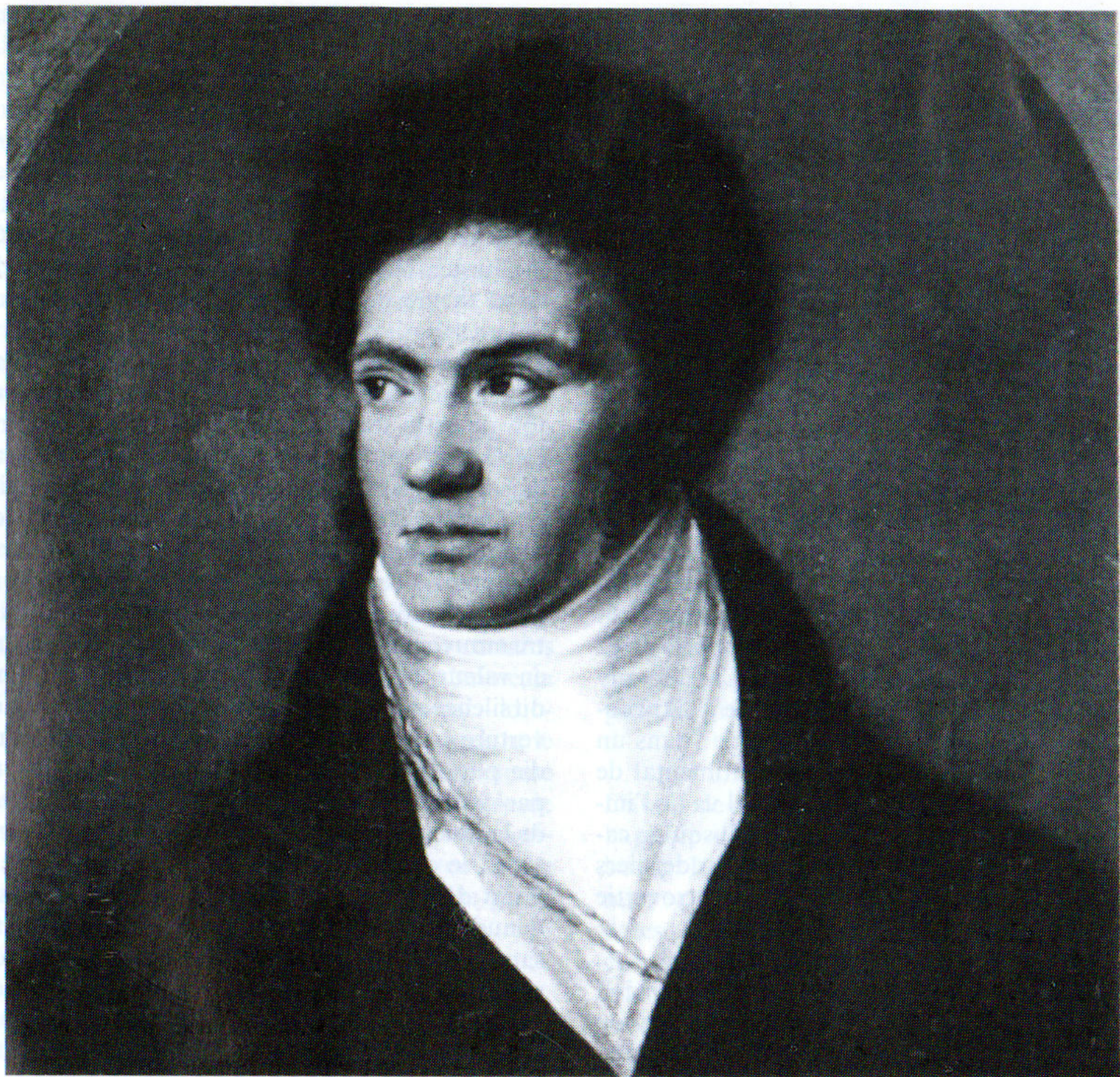
Ludwig van Beethoven. Oil painting by Isidor Neugass, c. 1806